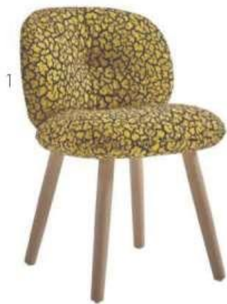
1. «Un cojín con piernas» era la idea inicial del estudio Yonoh al diseñar la silla Mullit .