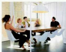
Appesi a un filo

Disegnata da Fernando e Humberto Campana per la collezione Objets Nomades di Louis Vuitton, Cocoon ondeggia dal suo gancio ed è realizzata usando la stereolitografia, stampa a 3D ad alta tecnologia (su ordinazione da Vuitton).