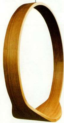
Un cerchio da arredo

Adagio è l'altalena da esterni disegnata da Francesco Rota per Paola Lenti in acciaio inox con rivestimento intrecciato a mano in corda (a partire da 2.000 euro).