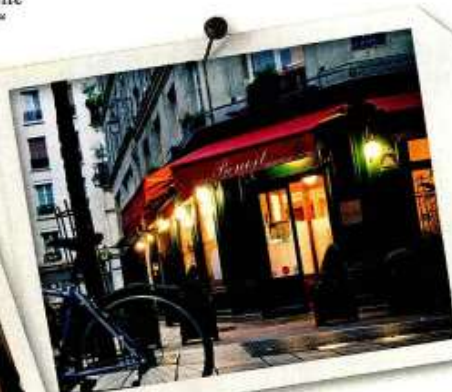
PARIS Klein, aber fein: das Restaurant Benoit