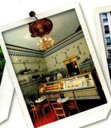
KÖLN Frühstücks-Location: Salon Schmitz