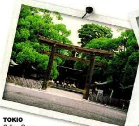
TOKIO Grüne Oase: Meiji-Jingu-Park mit Meiji-Schrein