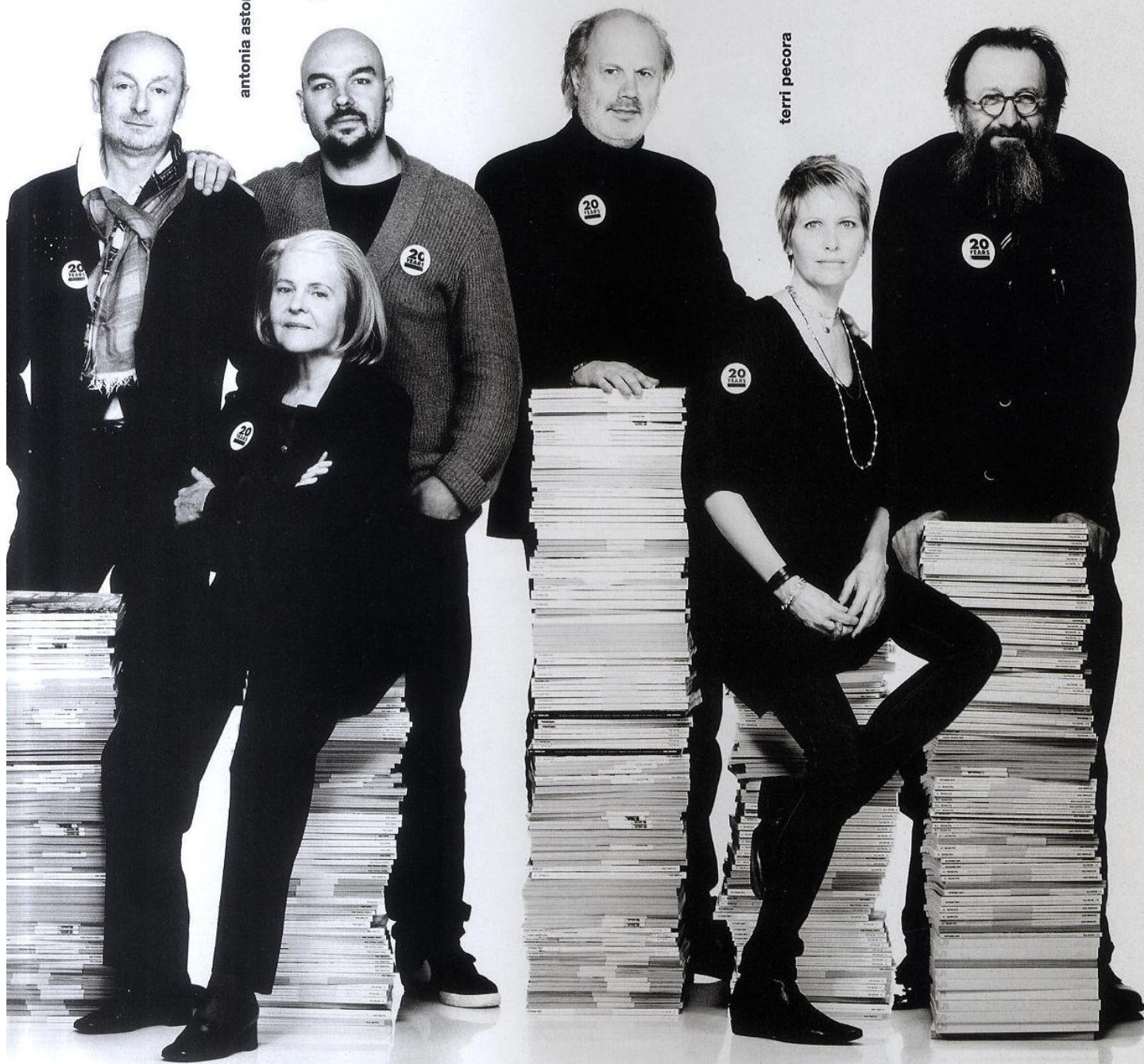
michele de lucchi