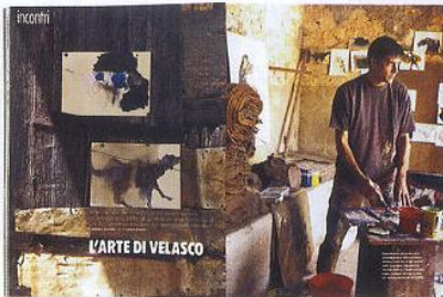
2004 OTTOBRE VELASCO VITALI