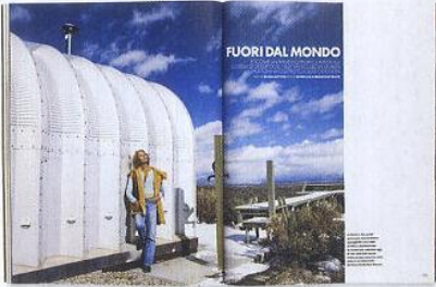
2003 DICEMBRE LAUREN HUTTON