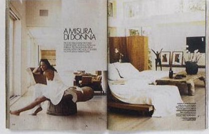
2003 MAGGIO DONNA KARAN