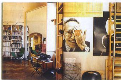
2006 GENNAIO/FEBBRAIO ACHILLE CASTIGLIONI