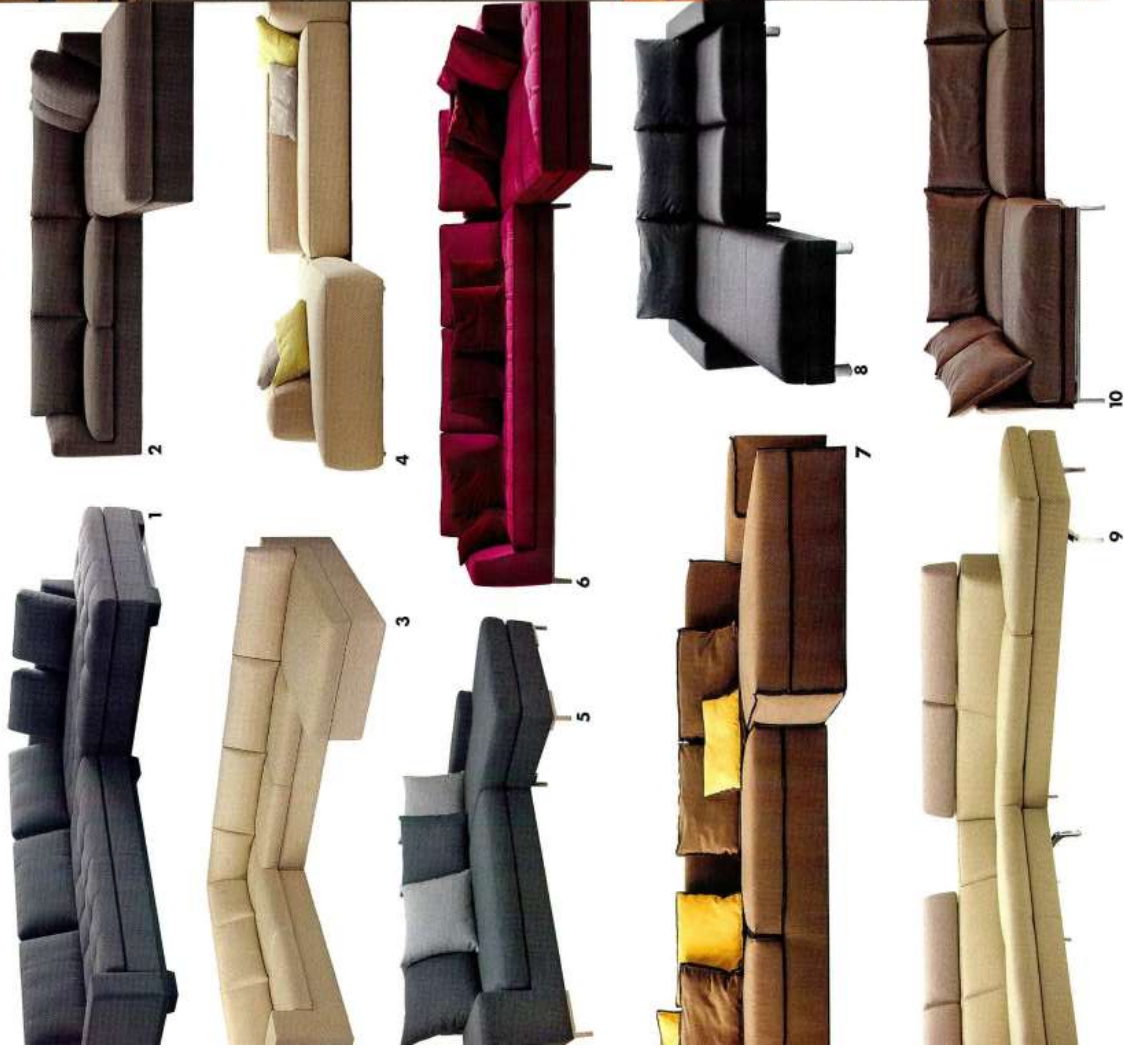
1. "Raspail", canapé + méridienne en tissu, cadre en inox brossé ou chêne massif, l. 197 x p. 96 x h. 78 cm, à partir de 2 950 € et l. 90 x p. 206 x h. 78 cm, à partir de 2 940 € (Stienne). 2. "Carmel" en tissu et métal, l. 228 x p. 220 x h. 82 cm, 3 104 € (Colligoris). 3. "Caneletto" en cuir, deux modules, l. 300 x p. 105 x h. 60 cm, à partir de 3 650 € (un/Armani Casa). 4. "Cloud" en tissu et bois, design Francesco Rota, l. 210 x p. 108 x h. 63 cm, prix sur demande (Lemo). 5. "Presto" en tissu et panneaux de fibres en pin massif/piètement en fonte d'aluminium finition brillante, l. 243 x p. 136 x h. 89 cm, 849 € (Comif).