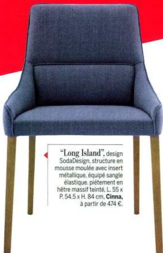
“Long Island”, design SodaDesign, structure en mousse moulée avec insert métallique, équipé sangle élastique, piétement en hêtre massif teinté, L. 55 x P. 54,5 x H. 84 cm, Cinna , à partir de 474 €.