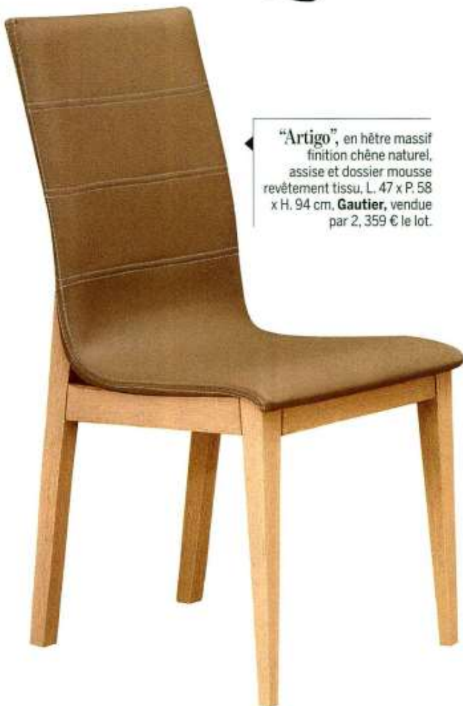
“Artigo”, en hêtre massif finition chêne naturel, assise et dossier mousse revêtement tissu, L. 47 x P. 58 x H. 94 cm, Gautier , vendue par 2, 359 € le lot.