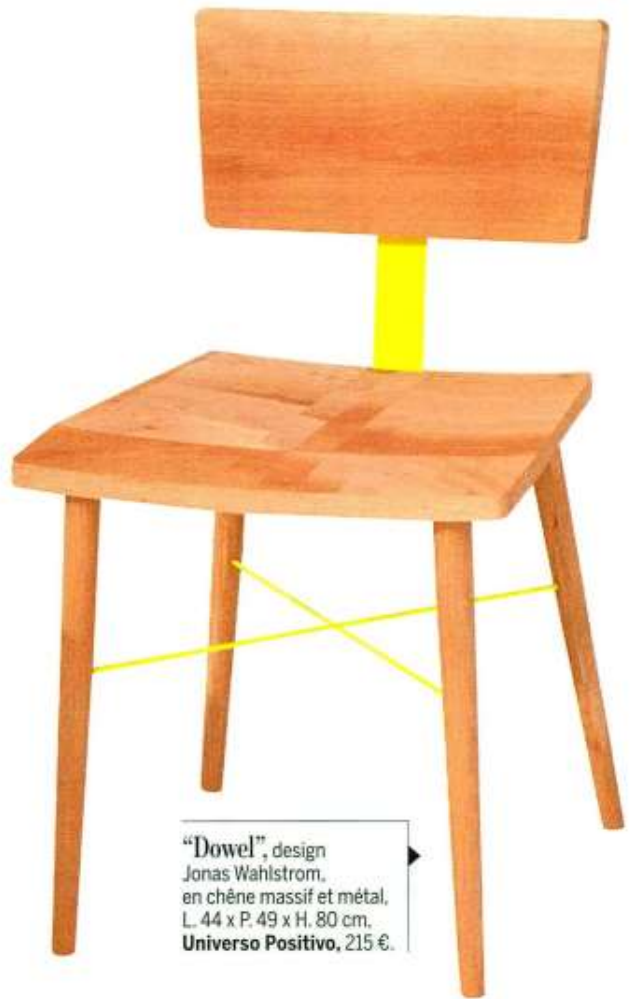
“Dowel”, design Jonas Wahlstrom, en chêne massif et métal, L. 44 x P. 49 x H. 80 cm, Universo Positivo , 215 €.