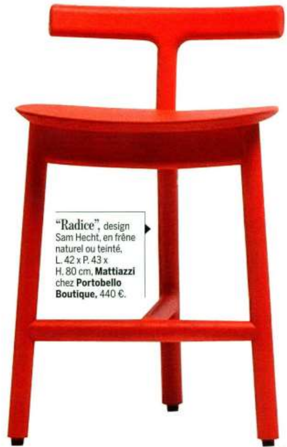
“Radice”, design Sam Hecht, en frêne naturel ou teinté, L. 42 x P. 43 x H. 80 cm, Mattiazzi chez Portobello Boutique , 440 €.