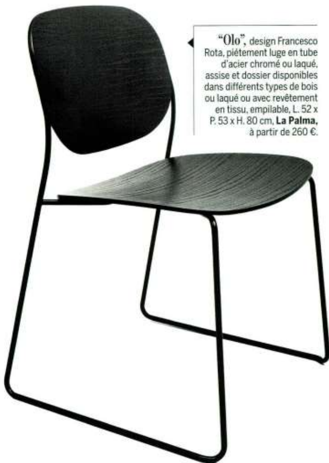
“Olo”, design Francesco Rota, piètement luge en tube d’acier chromé ou laqué, assise et dossier disponibles dans différents types de bois ou laqué ou avec revêtement en tissu, empilable, L. 52 x P. 53 x H. 80 cm, La Palma , à partir de 260 €.