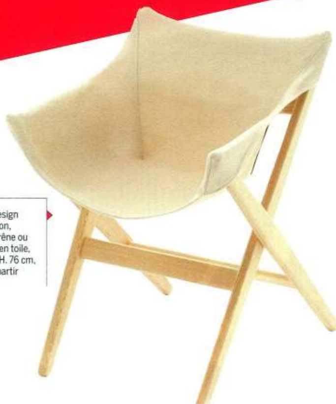
“Fionda”, design Jasper Morrison, structure en frêne ou chêne, assise en toile, L. 55 x P. 63 x H. 76 cm, Mattiazzi , à partir de 477 €.